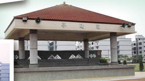
◀▲學校古老照片~建造中的迎曦亭