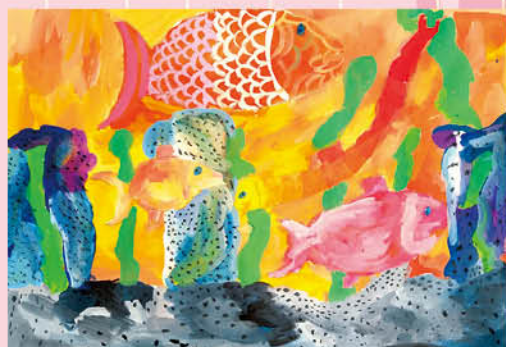
▲水彩畫 - 柔馨