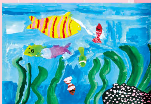
▲水彩畫 - 詠譚