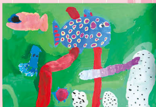
▲水彩畫 - 奕辰