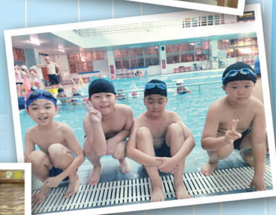
▼劍湖山之旅 ▲▶ 游泳趣