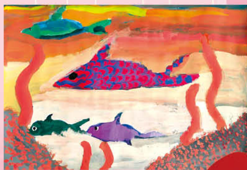
▲水彩畫 - 爾雅